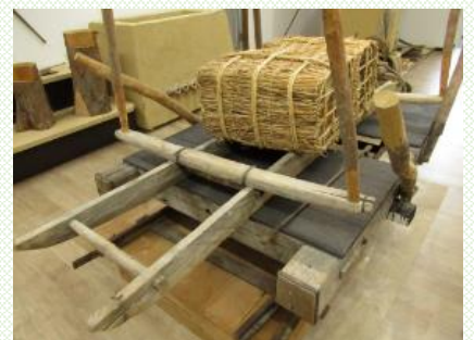
葛尾村伝習館にて撮影