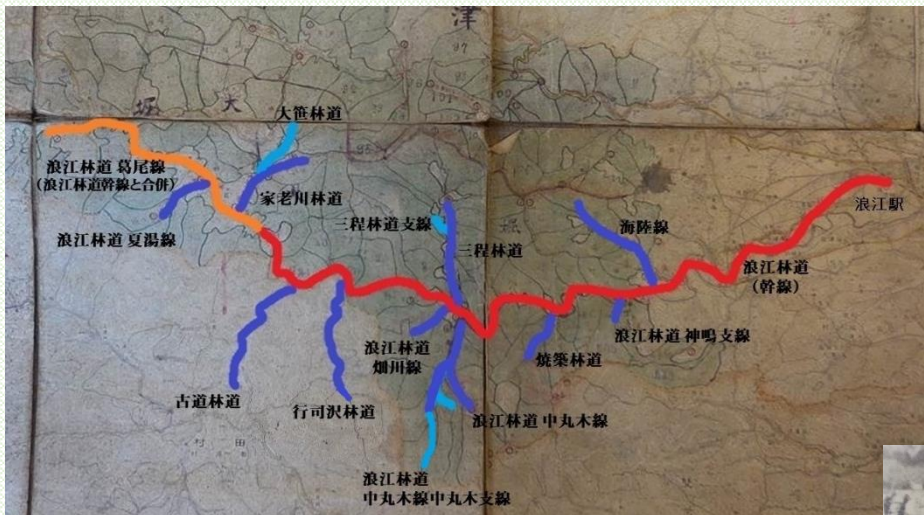
浪江林道の路線図 (関東森林管理局ホームページより引用)

おおよそ60年前まで、浪江町内をトロッコ列車が走っていたのを知っていますか？私共が町民の方々のお話を伺う中で、実際にトロッコ列車を目にしたご経験のある方や乗車したご経験のある方が、浪江町民の中には今も多数いらっしゃいます。「小学校時代通学に利用した」というお話も伺ったことがあります。そんな、浪江林道を調べてみました。