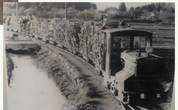
加藤製作所製の4.5トンディーゼル機関車 1946年製 製造番号:23041号 (写真は葛尾村郷土文化保存伝習館所蔵)

但し、ネットで当時の様子を撮影した写真や現存する遺構を見ることは可能です。また、葛尾村の伝習館には、当時のトロッコ列車等が現存しており、予約すれば見学可能とのこと。(電話 0240-29-2008 *平日のみ) この原稿を書くにあたり、ネットを駆使して多くのデータを集めてみました。現存するものは僅かなものの、JR浪江駅から大堀小学校付近を經由して、高瀬川沿いを走る当時の風景を想像しただけで、たまらなくワクワクしてしまいました。浪江町の大切な歴史だと思います。浪江町の産業の礎を築いた林業、その林業を支えた浪江林道について、町の歴史を語る上で記憶にも記録にもしっかりと刻んで頂きたいです。