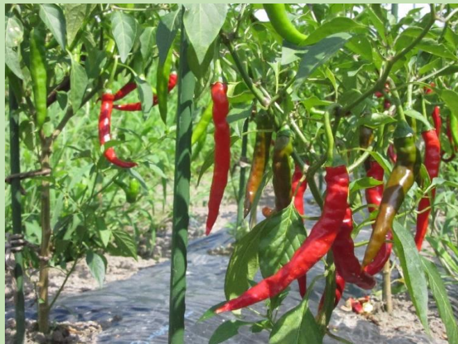
畑のとうがらしも元気に育っています！